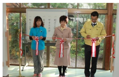
← 開所式の テープカット